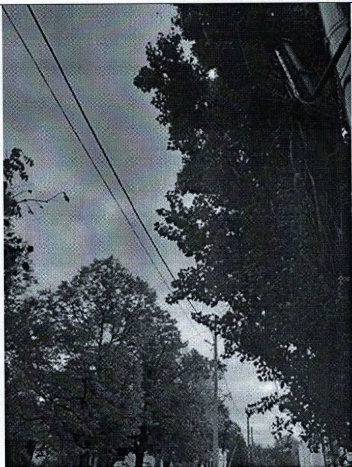
Съемка № 2